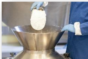
Использование вспомогательных веществ