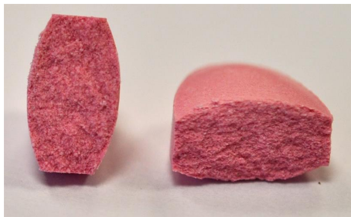
С использованием TopMill®